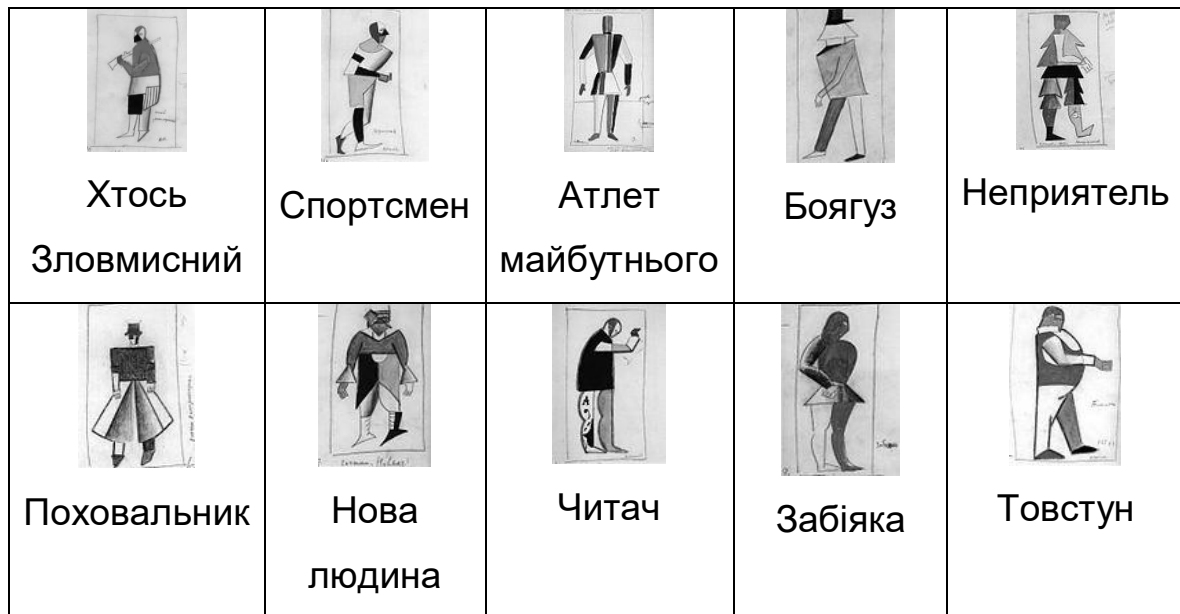
Рис. 1. Ескізи образів К. Малевича до опери «Перемога над сонцем»

до театральних образів митця. Адже правила проектування одягу будь-якої форми базується на наступних характеристиках композиції: силует; об'єм; колорит; характер або відсутність оздоблення; симетрія/асиметрія. В проектах сучасного одягу простежується запозичення як цілковите наслідування костюмних розробок Малевича, так і вибіркоче – у вигляді елементів форми, кольору, оздоблення.