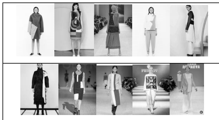
Рис. 6. Геометризм у моделях українських дизайнерів (2000-2016 рр.)